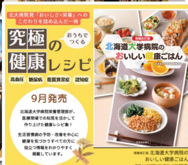
レシピ本も数十冊販売、マインド食も完売！