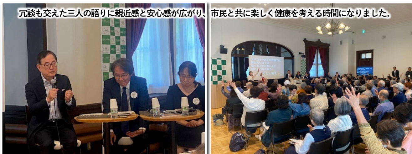
冗談も交えた三人の語りに親近感と安心感が広がり、市民と共に楽しく健康を考える時間になりました。