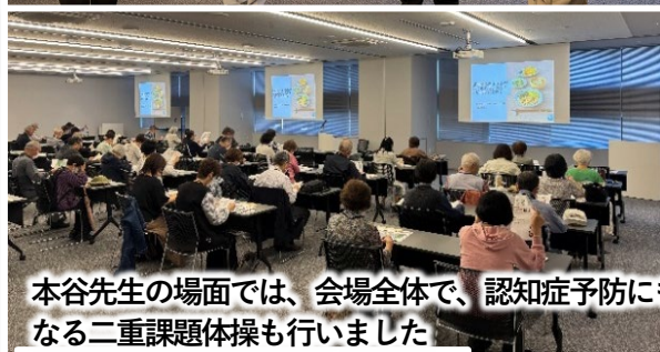
本谷先生の場面では、会場全体で、認知症予防にもなる二重課題体操も行いました