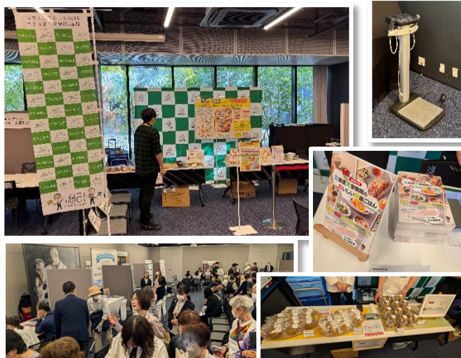
セミナー終了後、北大病院ブースには、沢山の市民の皆さんが訪れ、行列ができました。

健康意識啓発として、 体組成計 で健康チェックを体験いただき、医療スタッフがその結果を説明しました。また、 北大病院監修のレシピ本やマインド食 の販売も行いました。