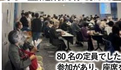
80名の定員でしたが、それを上回る参加があり、座席を追加して対応しました。