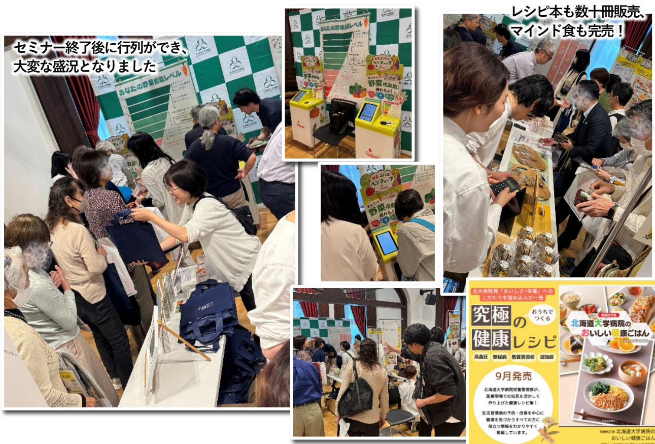
セミナー終了後に行列ができ、大変な盛況となりました

あわせて、 創基150周年の募金活動 や北大病院「ゆめ募金」の広報、パーソナルヘルスセンターによる ゲノム健診の紹介 を行い、未病段階からの健康管理を推進する取組を広く周知するとともに、市民との接点を創出し、予防医療の重要性と北大病院の社会的役割を広く発信することができました。